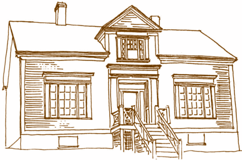
Lucarne Néogrecque | Saint John Ouest